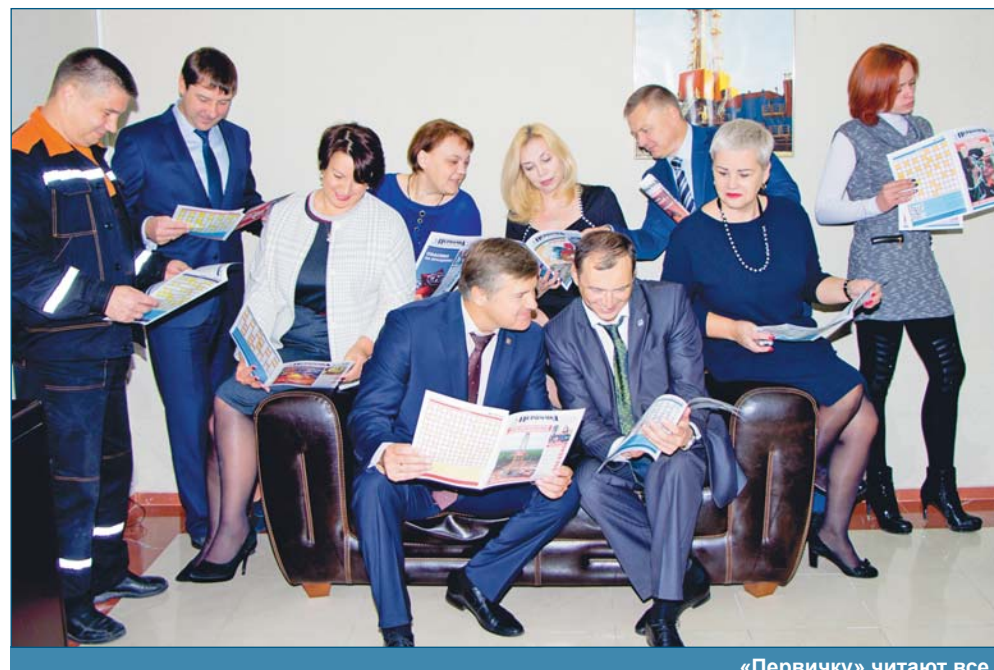
«Первичку» читают все

Руководство и инженерно-технические работники цеха по обслуживанию персонала сфотографировались с газетой