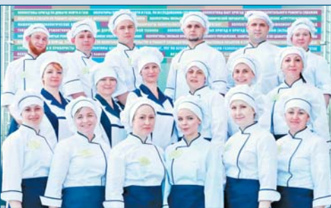
Участники смотра-конкурса «Лучший по профессии» среди работников общественного питания

◆ Стали известны имена победителей и призёров смотра-конкурса «Лучший по профессии» среди работников общественного питания ПАО «Сургутнефтегаз».