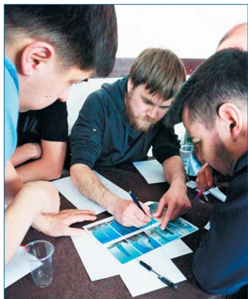
Команда «Реальные финансисты» (финансовое управление), II место

«Ум есть драгоценный камень, который более красиво играет в оправе скромности» – известную фразу когда-то написал русский писатель, прозаик и драматург Максим Горький. Древнегреческий философ Аристотель утверждал, что ум заключается не только в знании, но и в умении прилагать знания на деле. Члены первичной профсоюзной организации аппарата управления ОАО «Сургутнефтегаз», принявшие участие в очередном эмоциональном турнире «Сила интеллекта», доказали: накопленным багажом знаний они смело могут апеллировать к соперникам по игре.