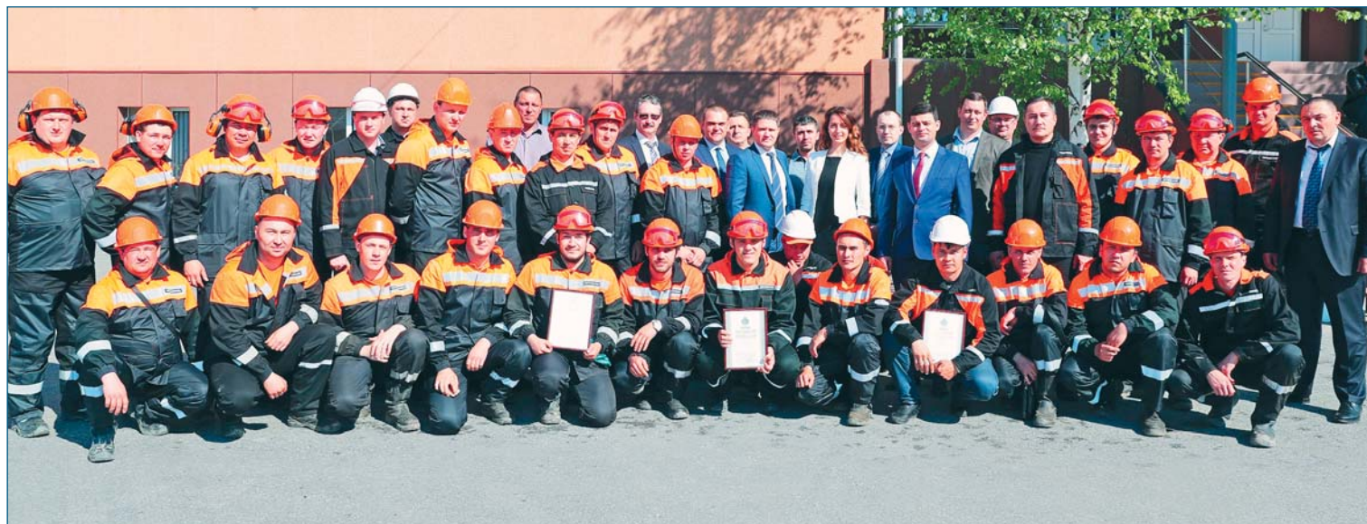
Участники смотра-конкурса «Лучший по профессии» среди звеньев комплексов по химической обработке