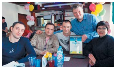
Команда «Зелёные интеллектуалы» (управление экологической безопасности и природопользования), III место