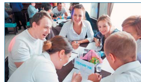
Команда «Техникум» (техническое управление ОАО «Сургутнефтегаз»)